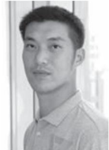
ธนาธร จึงรุ่งเรืองกิจ

โพสต์นี้ของ “ซ้อ” ไม่ได้สร้างความแปลกใจเท่าไร สังคมออนไลน์ ที่ประณามยิ่งเชื่อว่า